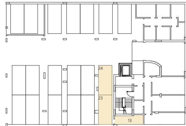
Piso -1 | Estacionamento Nº23 e Nº24 Arrecadação Nº13 - 7,38m 2